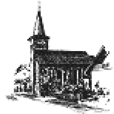
Filialkirche St. Bonifatius Butterstadt