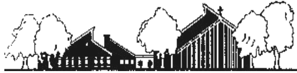
Pfarrkirche Erlöser der Welt Bruchköbel